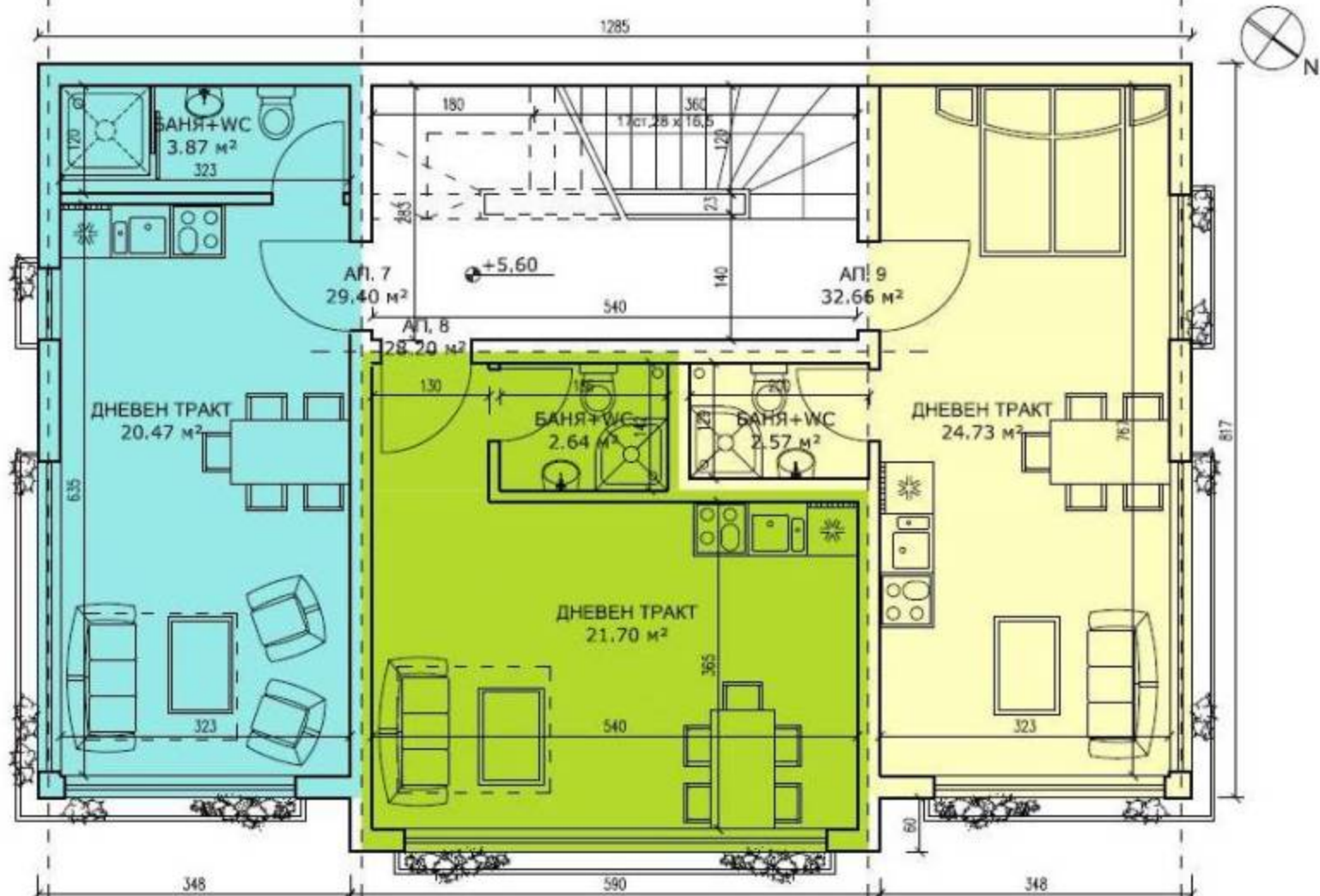
РАЗПРЕДЕЛЕНИЕ 3 ЕТАЖ ЗАСТРОЕНА ПЛОЩ 108 м²